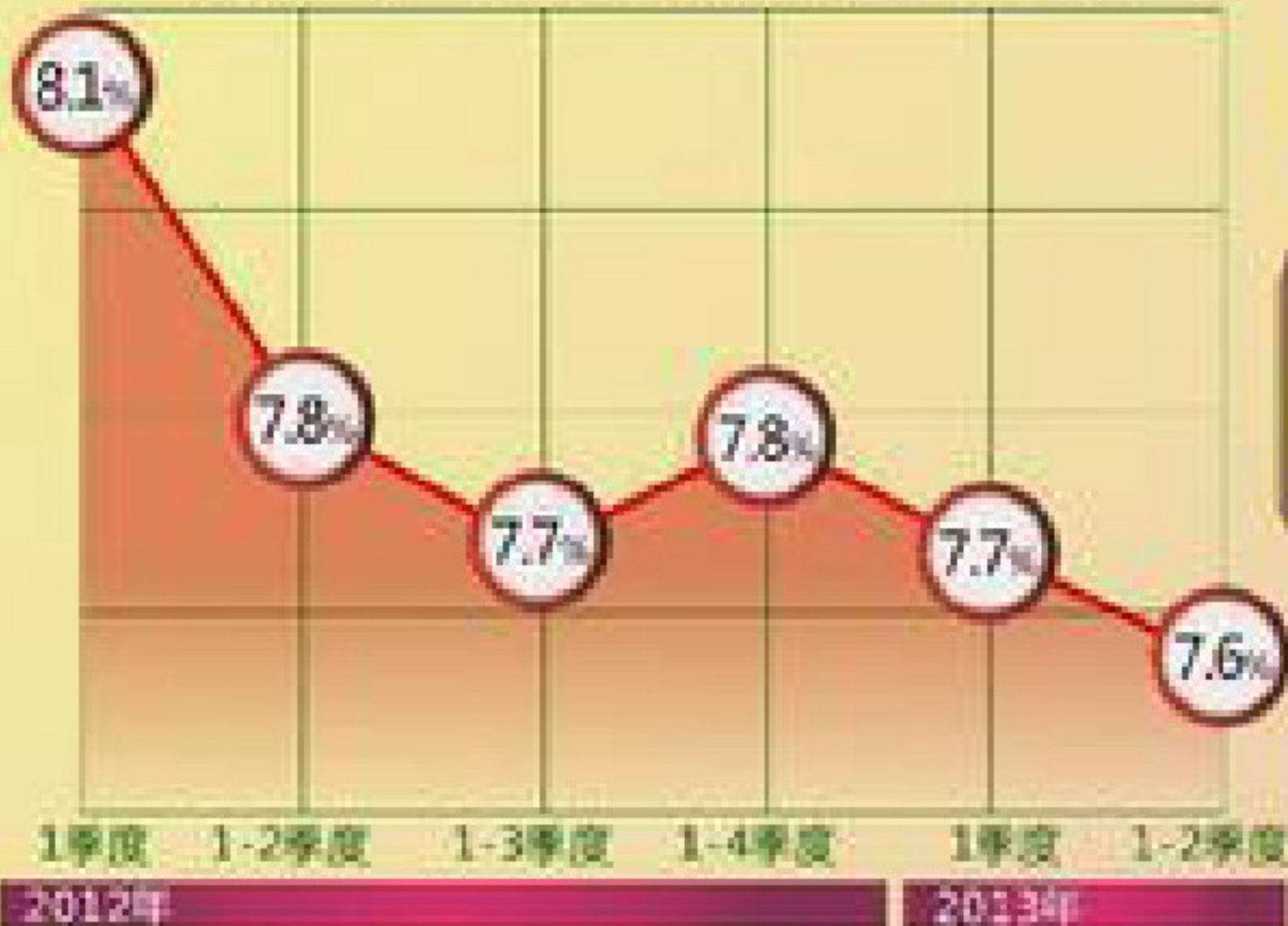
国内生产总值增长速度（累计同比）